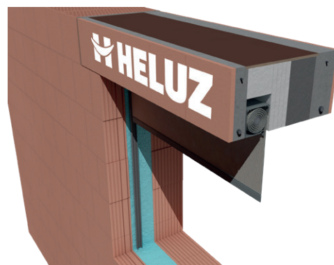
③b SCHRÁNKA SO SCREENOM