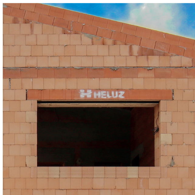
④ Zabudovaný preklad HELUZ FAMILY 3in1 nosný.