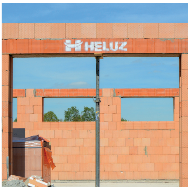
③ Pohľad zvonku, detail podopretia prekladu väčšej dĺžky.