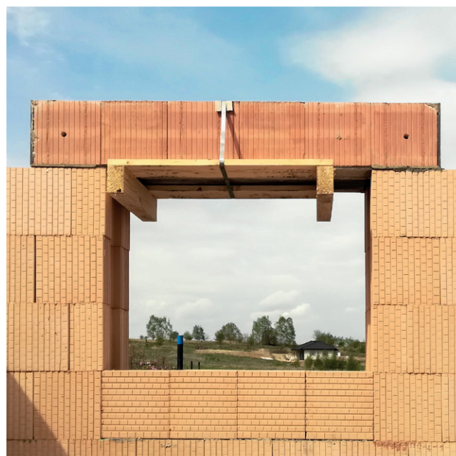
② Pohľad na uloženie prekladu z vnútornej časti budovy. Paleta sa tesne po osadení prekladu jednoducho zloží.