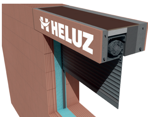
③a SCHRÁNKA S ROLETOU