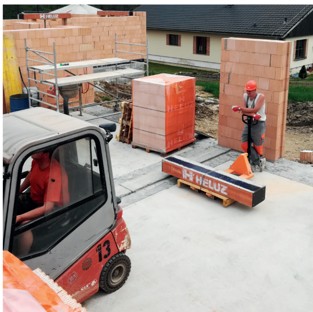
① Príprava pred uložením.